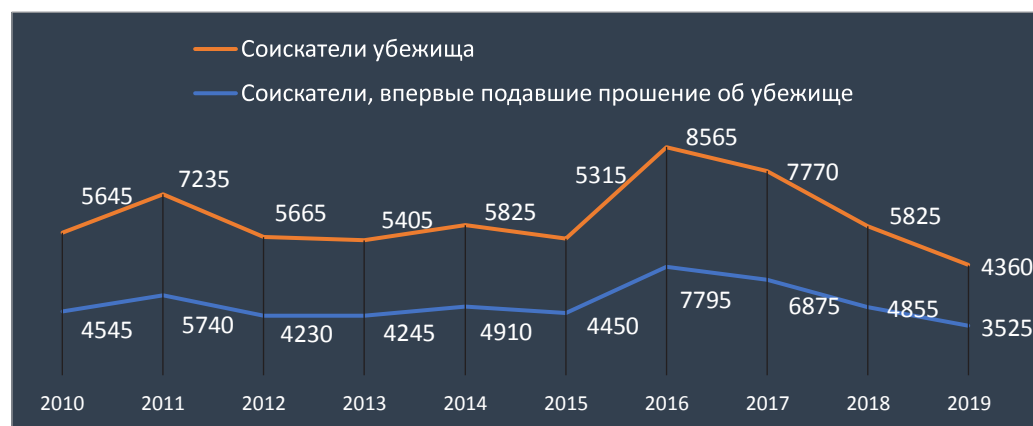
Рис.1 Ходатайства о предоставлении убежища гражданам Армении в государствах-членах ЕС и ЕАСТ, 2010-2019 гг.